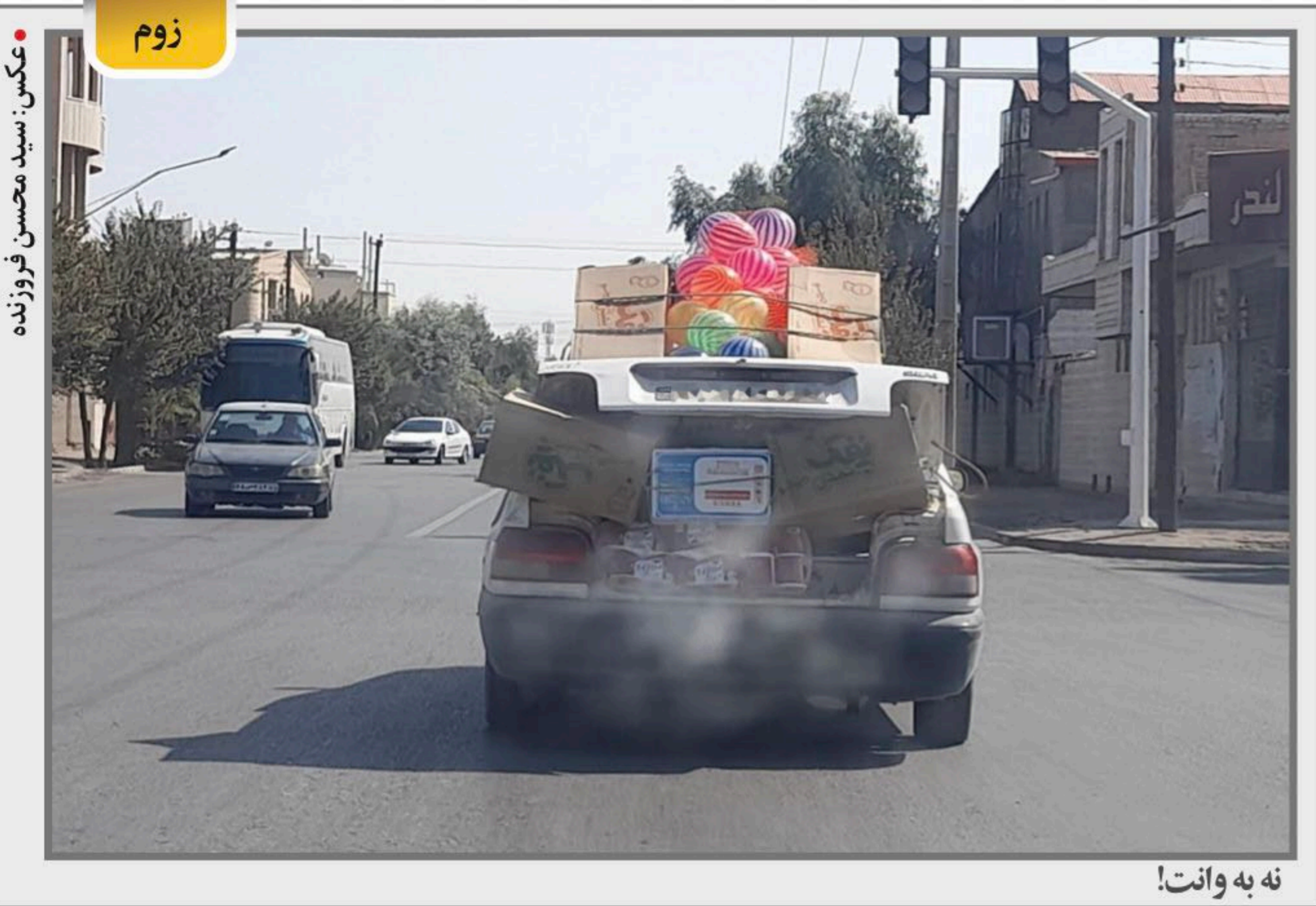
نه به وانت!