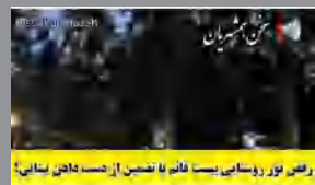
رئیس نوری روستایی نیست با تضمین از مسدود شدن جاده

سخن همشهریان: سلام اینجا بیست قائم حدفاصل بلوار عباسپور تا بلوار ولایت هست و این رقص نور روشنائی بیست که با تضمین بینایی شما رو نابود میکنه!