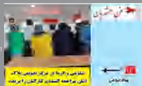
تاسیس و احداث کارخانه سیمان در شهر سیرجان

سخن همشهریان: سلام اینجا بیست قائم حدفاصل بلوار عباسپور تا بلوار ولایت هست و این رقص نور روشنائی بیست که با تضمین بینایی شما رو نابود میکنه!