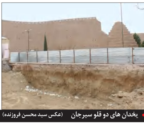
یخدان‌های دو قلو سیرجان • یخدان مویدی کرمان