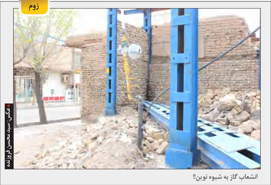
عکس: سید محسن فرزندان