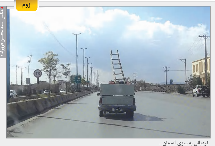
نردبانی به سوی آسمان...