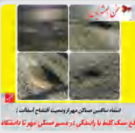
اسفند ماهی ستان، مهر و صیبت افتضاح اسفند / این سنگ کله با یارنگی در مسیر ستان مهر تا دماستان