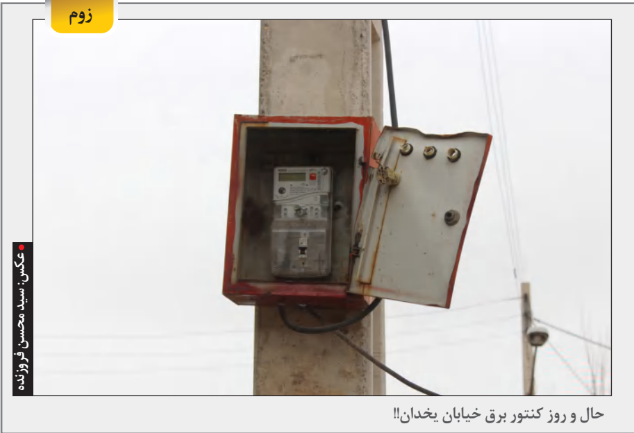
حال و روز کنتور برق خیابان یخدان!!