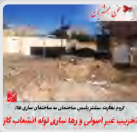
تخریب غیر اصولی و رها سازی لوله انشعاب گاز / مردم نظارت بصورت مستمر پلیس ساختمان به ساختمان سازی ۱۵

سلام صبح بخیر! این چندتا عکس به خوبی وضعیت افتضاح آسفالت مساکن مهر تا پردیس دانشگاه آزاد را نشان می‌دهد. متأسفانه به قدری این آسفالت داغون هست و جاله‌های فراوانی داره که بنده تضمین میکنم همشهریانی سنگ کله دارن اگر یکی دوبار توی این مسیر رانندگی کنن قطعاً سنگ کله شون دفع میشه، همچنین اگر خانم بارداری هم سرنشین به خودرو باشه بر اثر ضربات ناشی از افتادن ماشین توی گودال‌های این مسیر، دچار زایمان زودرس میشه. مسئولین خجالت بکشین، فقط یکبار از این مسیر عبور کنین تا بفهمین ماها چی می‌کشیم. #انتقاد#حق#مردم#است