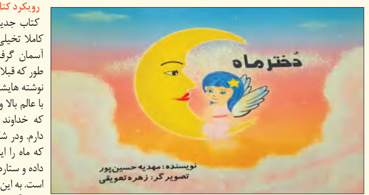
نویسنده: مهدیه حسین پور تصویرگر: زهره توبیعی

دوست دارم در آینده باز راجع به مقدسات و عرفان بنویسم. و اشتیاق دارم مردم را به سمت وسوی این که بیش از پیش طعم ناب و سحر آمیز عشق به خدا را احساس کنند. و این که در همه جا و همه حال باید به توکل کرد و از او مدد جست. و با تالیف چنین کتابهایی درراه ظهور مولای جان امام زمان گام هایی بزرگ بردارم. مطمئنم که در آینده با یاری پروردگار این اتفاق زیبا خواهد افتاد. بازخورد مخاطبان را از چه طریق دریافت می‌کنید و تاکنون کدام یک از کتابهایت با استقبال بیشتری مواجه شده است؟ از برخوردارهایی که با من پس از مطالعه کتاب هایم دارند. آن ها کتاب عشق و زندگی جلد ۲ را بیشتر دوست داشتند. و دختر ماه بسیار پر فروش بود. مراکز فروش کتاب دختر ماه را معرفی کنید