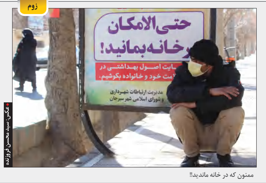
ممنون که در خانه ماندید!!